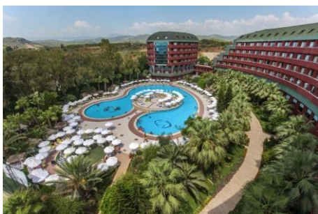
Бассейн 1 (Relax бассейн)

Время работы бассейнов может меняться в зависимости от погодных условий.