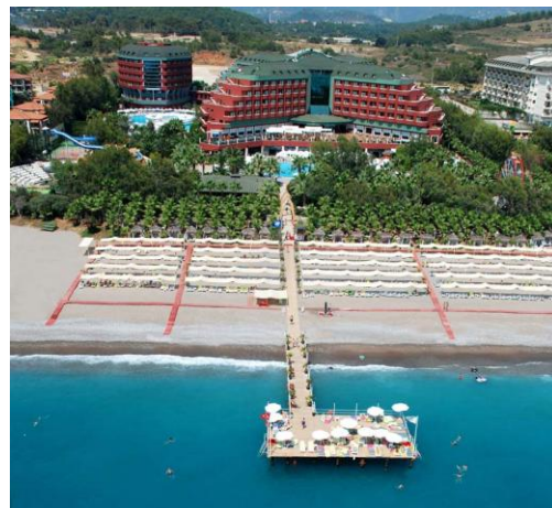
Главное Здание и Пристроенное Здание

Для Вашего прекрасного отдыха создан великолепный отель, состоящий из одного 6-ти этажного корпуса с 416 стандартными номерами, с 4 панорамными лифтами и одного 7-ми этажного корпуса с 3-мя лифтами и 79-ми семейными номерами и 3 стандартных номера.